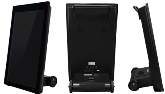
<屋外用> ポータブルサイネージ