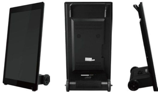
<屋内用> ポータブルサイネージ