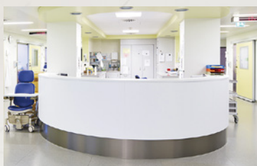
▶ ナースステーション