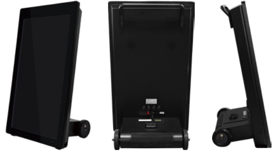
<屋外用> ポータブルサイネージ