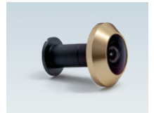
ドアスコープバレル