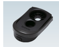
ドアノックカバーケーシング