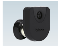
モーションセンサーユニット